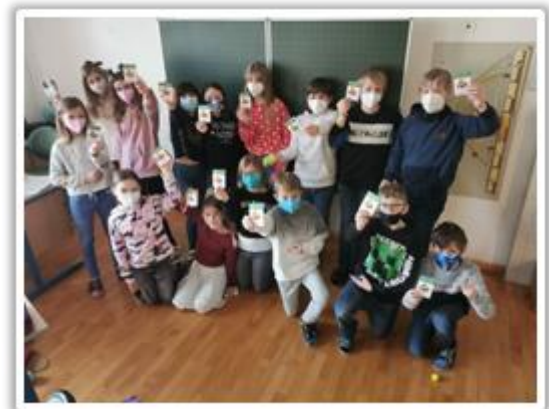
Die stolze 1b mit ihrem Führerschein.

Im Biologieunterricht erfuhren die Schüler*innen der ersten Klassen vieles zum Thema gesunde Schulkjause und Ernährung. Abgeschlossen wurde das Thema mit einer praktischen und theoretischen Führerscheinprüfung.